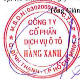
ĐỖ TIẾN DŨNG