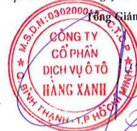
ĐỖ TIẾN DŨNG